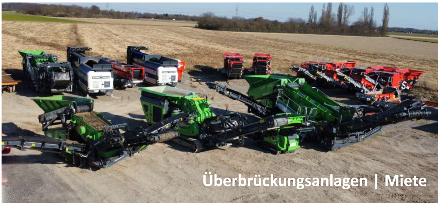
Überbrückungsanlagen | Miete